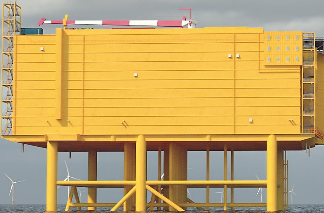
Offshore: IJmuiden Ver (4 GW)

2 x 2 GW platforms or island? Direct Current High capacity World first